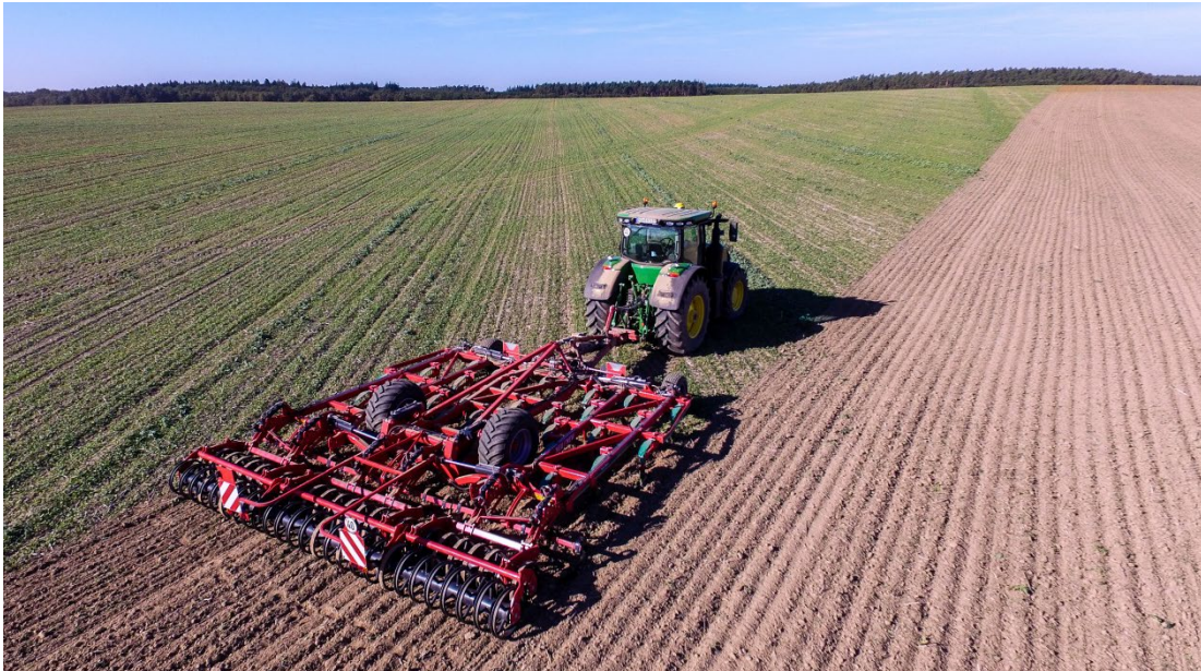
Kverneland Turbo T i-Tiller: semplice, sicuro ed efficiente per l'operatore e per l'ambiente

Il risparmio di sementi e fertilizzanti grazie ad un'applicazione più precisa e all'assenza di sovrapposizioni ha un ritorno immediato sull'investimento. Le soluzioni iM Farming®: GEOCONTROL®, GEOSEED®, GEOSPREAD® e MULTIRATE (rateo variabile) si sono già distinte ed affermate nella gamma di seminatrici, botti del diserbo e spandiconcime Kverneland.