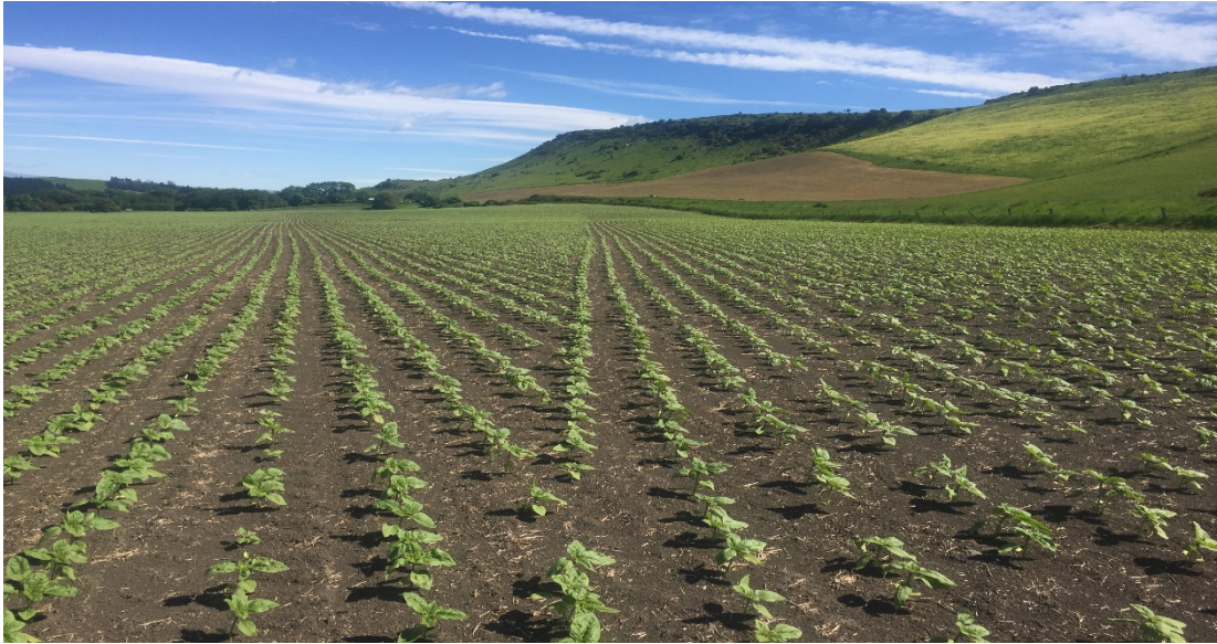
Efficiente utilizzo di terreno, acqua e fertilizzante – semina con GPS e GEOCONTROL